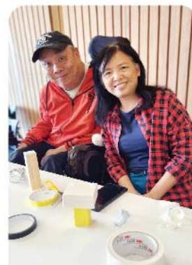
會員何生及家人享受工作坊