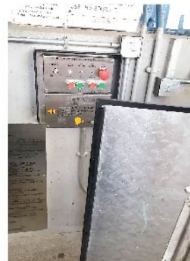
底按鈕盤位置不當