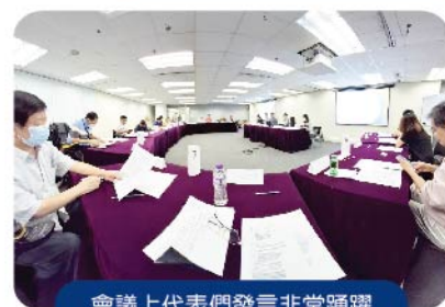
會議上代表們發言非常踴躍