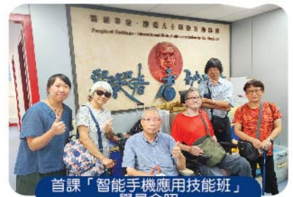
首課「智能手機應用技能班」學員合照