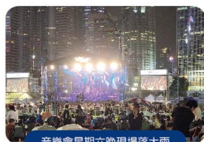
音樂會星期六晚現場落大雨