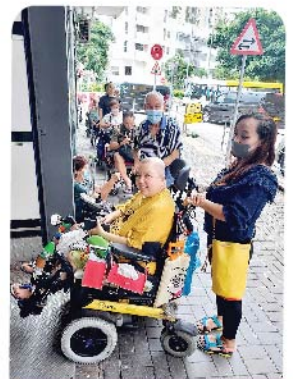
會員排隊等攞月餅

此次的燈籠很美，令大家驚豔。但由於數量不足以讓每位會員都能拿到燈籠，我們儘量把燈籠送給家中有小朋友的會員；個人會員每人領取3塊迷你月餅，家庭會員和部分與家人同住的會員則領取一整盒月餅；最後剩下的近10隻燈籠有品質問題不亮燈，為避免浪費，本會立即買來一些幻彩電子燈裝入原本的燈籠內送