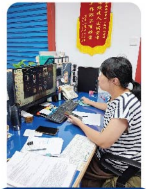
行政幹事鄭女士在紀錄會議