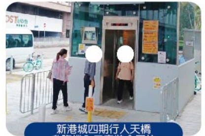
新港城四期行人天橋 升降機入口安裝金屬柱

聖毅忍者 People of Fortitude 慈善機構 CHARITABLE ORGANIZATION 聖毅忍者·國際人士互助及援助協會 PEOPLE OF FORTITUDE · INTERNATIONAL MUTUAL AID ASSN. FOR THE DISABLED 九龍新蒲崗五芳街31-33號永順工廠大廈7字樓8座