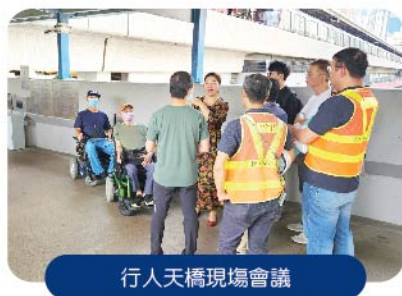
行人天橋現場會議