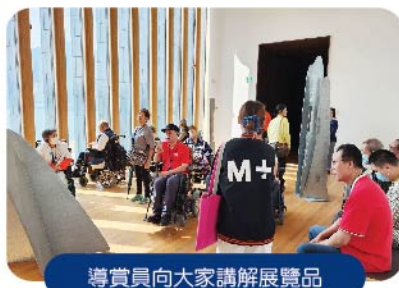
導賞員向大家講解展品