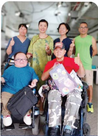
職員義工和會員合照

2024年9月16日至17日，本會向接近300名會員和家庭成員派發由奇華餅家（下稱奇華）贊助的一批迪士尼。彼思系列SweetDreams走馬燈中秋月餅禮盒。這批月餅設計獨特、做工精緻，外殼是一隻會轉的燈籠，有開關掣，內裝6塊不同口味的迷你月餅，每盒售價高達328元港幣。