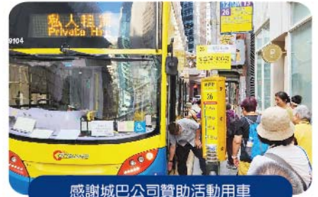
感謝城巴公司贊助活動用車