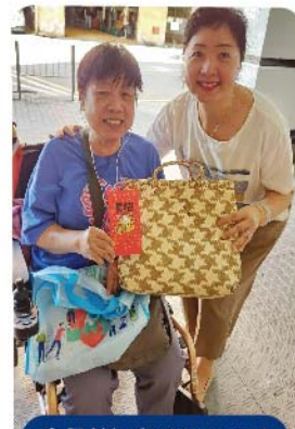
會員英姐和總幹事合照